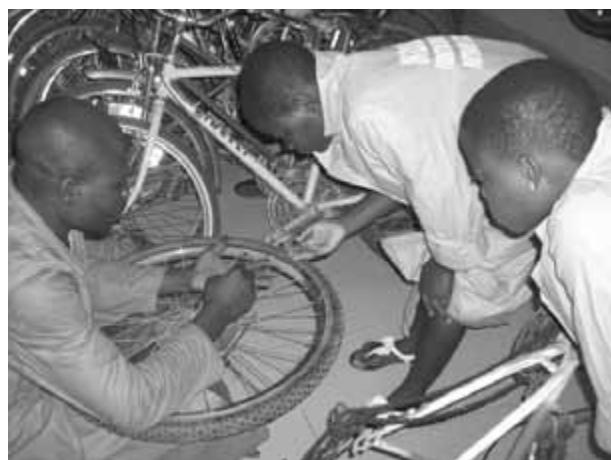
Sur les 13 élèves inscrits au programme de formation, huit sont des femmes.