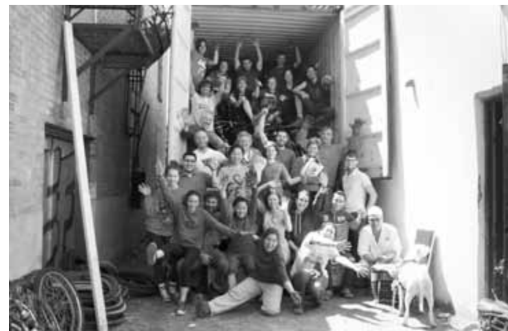
Le 28 avril, une trentaine de bénévoles étaient au rendez-vous pour charger le dernier conteneur de la rue Saint-Urbain et fermer les dernières boîtes la veille du déménagement de Cyclo Nord-Sud dans ses nouveaux locaux de Saint-Michel.