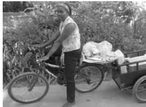
Grâce à un don d'un vélo, d'une remorque et de 100$, une femme démarre sa minientreprise, Limbé.