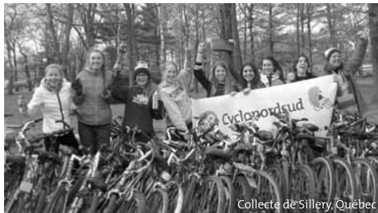
Collecte de Sillery, Québec

Les collectes de vélos sont organisées bénévolement par des groupes de toute sorte (écoles, clubs, organismes) ou par des citoyen(ne)s engagé(e)s. En plus d'être des activités fort amusantes et des gestes simples pour l'environnement, elles apportent une expérience concrète de solidarité.