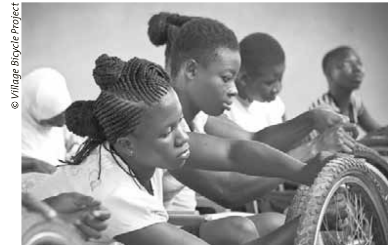
Des Ghanéennes apprennent le b.a.-ba de la mécanique vélo.