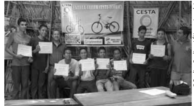
Des jeunes diplômés en mécanique vélo.

Enfin, un partenariat a été créé avec une école pour démarrer le programme « Escuela a bici », qui vise à permettre aux élèves de louer des vélos à bas prix pour se rendre à l'école.