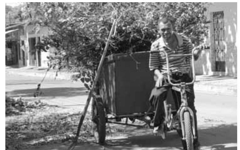
CESTA promeut l'utilisation du vélo en milieu rural.