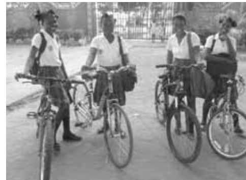
La création d'un nouveau parc de vélos en milieu scolaire fait des heureuses, Ouanaminthe.