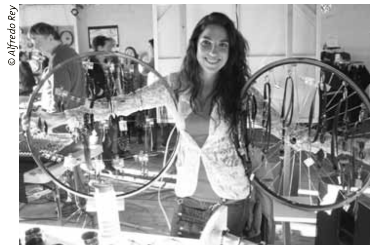
Au Marché CyclArt, une artisane vend ses bijoux en chambres à air.