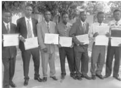
Les diplômés en mécanique vélo de la première cohorte, Limbé.

Total de 5 175 vélos et 27 machines à coudre depuis 2006